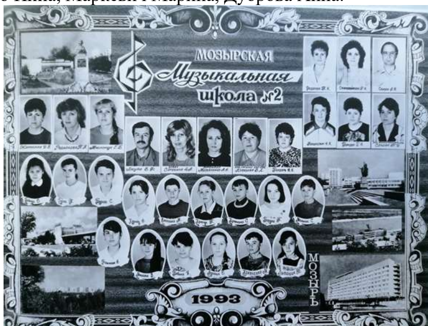
Выпуск 1993 года