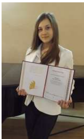
Ученик года 2012г.