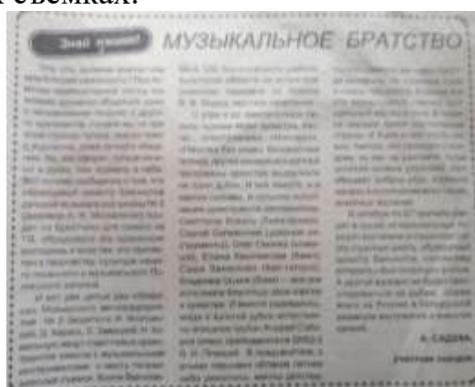
Заметка в газете от 23 августа 1996г.