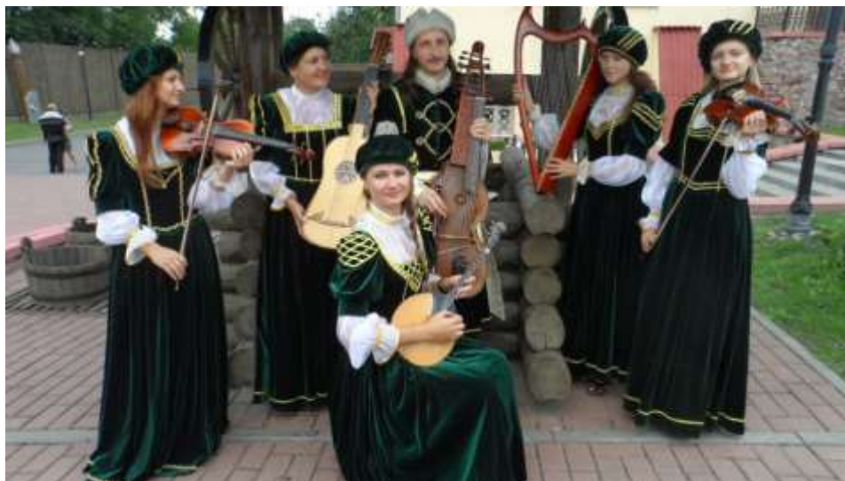
Народный ансамбль старинной музыки «Альба Рутенія» (рук. А. Шклёда)