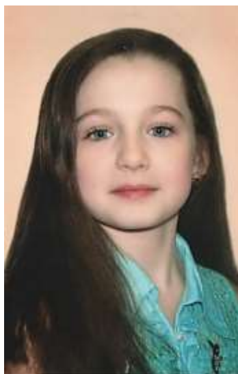
Ученик года 2014, 2015.