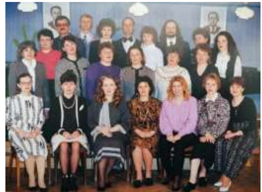
Коллектив школы. Апрель 1996 года