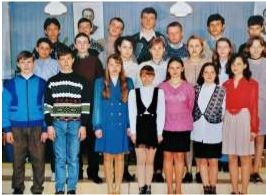
Выпускники 1996 года