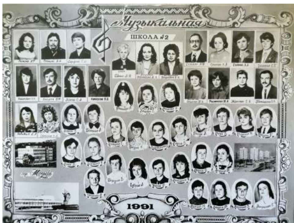
Выпуск 1991 год