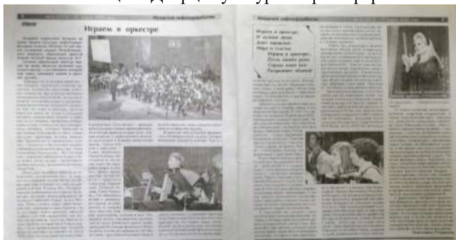
Статья о баянном оркестре в газете «Мозырский нефтепереработчик». 22 апреля 2006 года