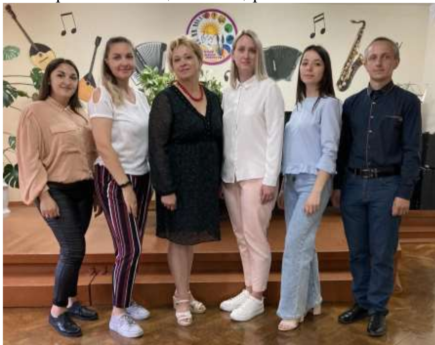
Учителя школы по адресу аг. Слобода

С большой радостью ждут подрастающих музыкантов люди преклонного возраста, больные в отделении сестринского ухода. Ежегодно, совместно с районным территориальным центром социального обслуживания проводятся благотворительные акции и концерты.