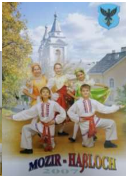
Коллективы школы с гастролями в Германии. 2005 год

В 2006 году в школе работают 56 педагогов и обучаются 560 учащихся.