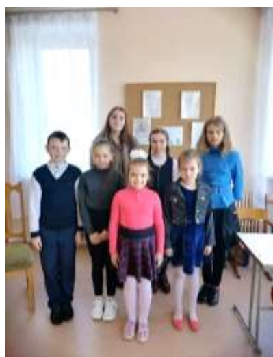
Академический концерт аг. Осовец, 2021 год.