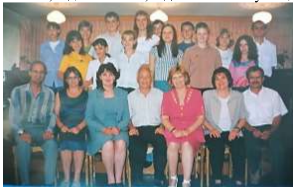
Выпуск 2003 года