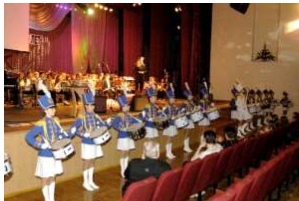
30-летие школы. 2003 год.