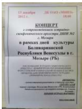
Афиша. 2012 год.