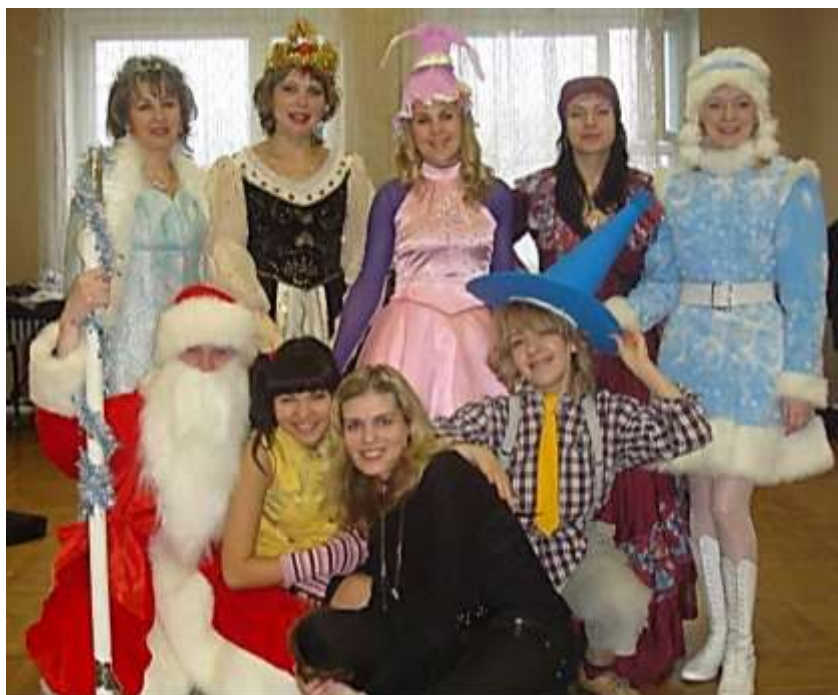
Новогодний утренник для учащихся нашей школы. 2009 год