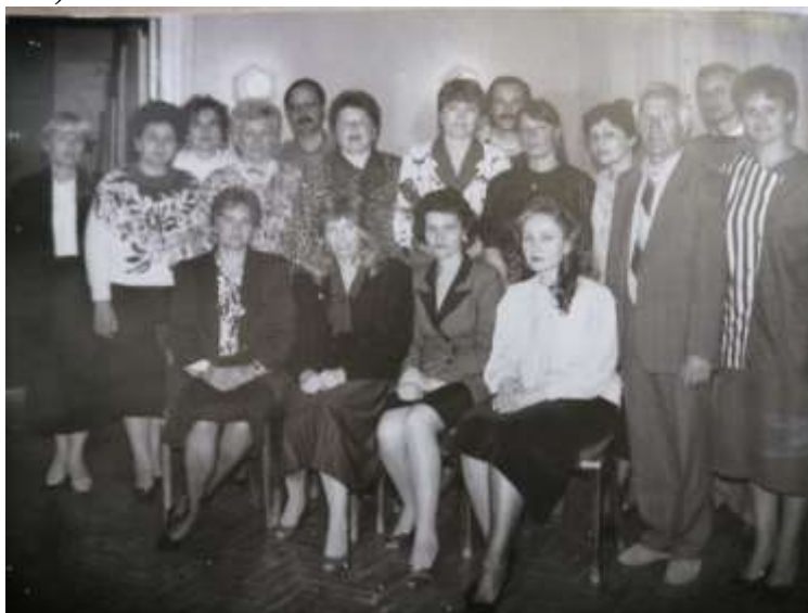
Преподаватели школы. 1994 год.