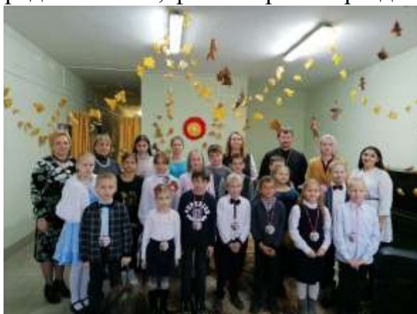
Праздничный концерт «Посвящение в первоклассники»