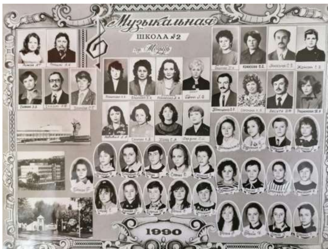
Выпуск 1990 год