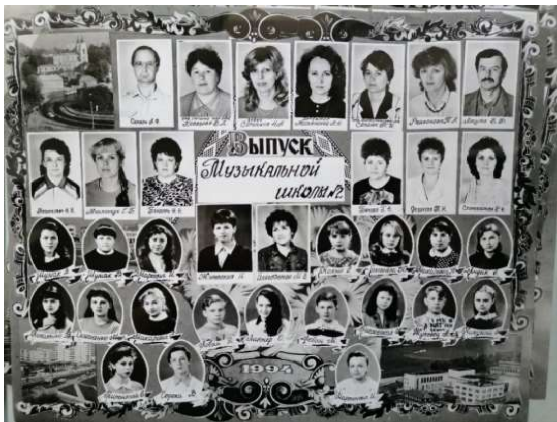
Выпуск 1994 года